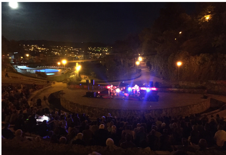
Concerto com o Duo Cordis, 9 de Junho

Recordamos ainda o funcionamento regular no ano de 2017 do Restaurante Gustav, da Piscina e do Campo Desportivo , serviços prestados por terceiros e que constituem uma actividade da maior importância para o cumprimento dos encargos do Clube. Salientamos a excelente conversão do