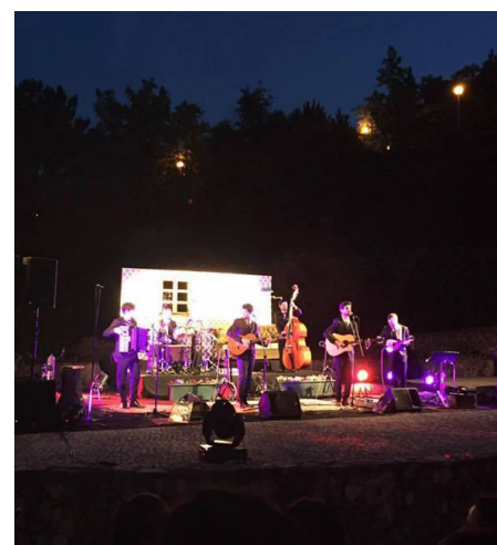
Grupo de Música Portuguesa “Os Quatro e Meia”, 11.06.16

Gostaríamos, por último, de vos dar conta da realização da 4ª edição do evento “Há música no Jardim!” , em parceria com a Junta de Freguesia de Santo António dos Olivais, com o acolhimento de quatro concertos no mês de Junho, entre música clássica, jazz e música portuguesa, no magnífico espaço ao ar livre do anfiteatro. A presença de uma assinalável corrente de público, vem confirmar a crescente aceitação desta inovadora iniciativa cultural e desafiar a sua organização para uma empenhada e ambiciosa continuidade futura.