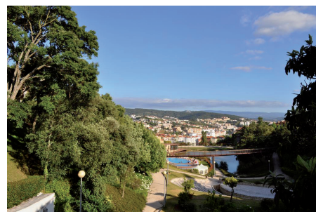
Manuel Guerra ©

Procuraremos nos próximos meses dinamizar algumas iniciativas que permitam dar a conhecer as potencialidades e beleza dos jardins da Quinta de S. Jerónimo, no coração da cidade e à porta das nossas casas, procurando motivar a sua descoberta e plena fruição. O Verão está perto e convida para actividades ao ar livre: ateliers criativos para crianças, aulas de yoga para adultos, Fado de Coimbra e Música Coral. Tudo isto irá acontecer entre os meses de Junho e de Setembro. Contamos com o seu interesse e participação!